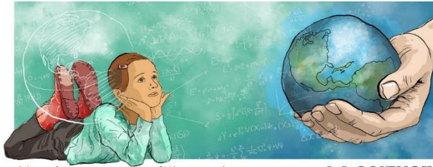
Un rêve pour les filles et les garçons: LA SCIENCE

Notre colloque 2019, organisé en commun avec Parité Science le 9 novembre à Grenoble, sur le thème : « Un rêve pour les filles et les garçons : la Science », a été un franc succès, avec environ 180 participant·es et 70 lycéen·nes, ainsi que les activités organisées autour par Parité Science (exposition Infinités Plurielles , ateliers de physique, concours d'affiches...). Les actes seront bientôt publiés.